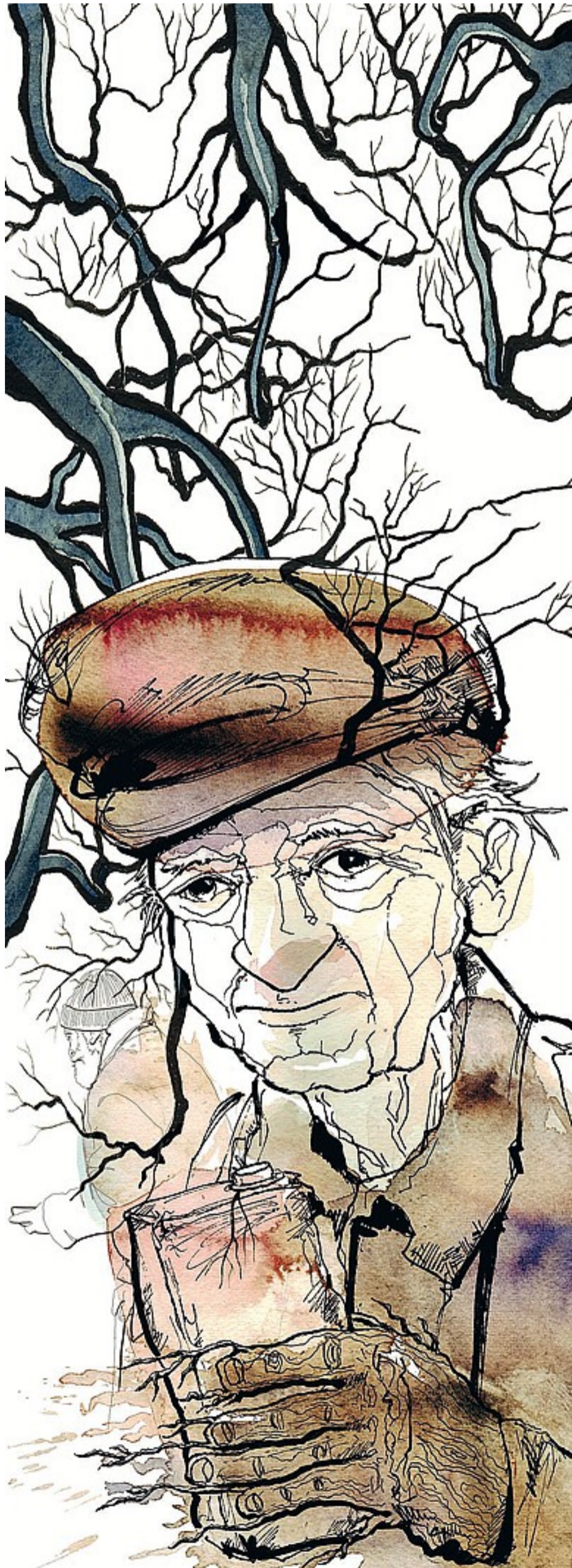
ILLUSTRAZIONE DI FABIO DELVÒ

resterai dentro un dolore che non è nostro». Con l'Ultimo spettacolo del cinema di una piccola cittadina del Texas, si consuma la giovinezza di una generazione (anche cinematografica). Nel film del 1971 di Peter Bogdanovich.